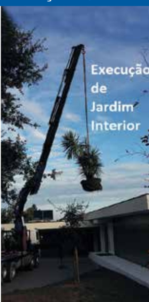
Execução de Jardim Interior