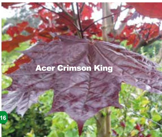
Acer Crimson King