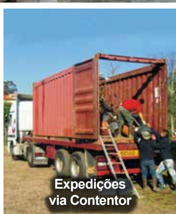
Expedições via Contentor