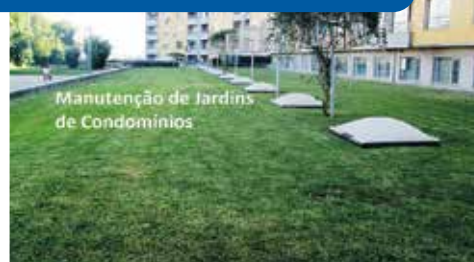
Manutenção de Jardins de Condomínios