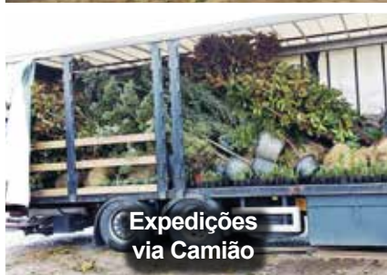
Expedições via Camião