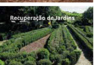
Recuperação de Jardins