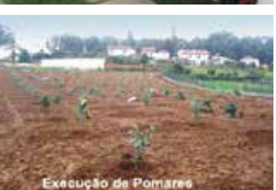
Execução de Pomares