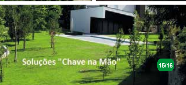
Soluções "Chave na Mão"