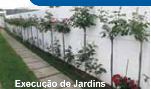
Execução de Jardins