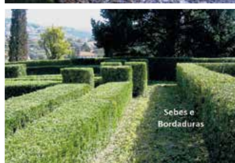
Sebes e Bordaduras