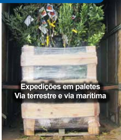
Expedições em paletes Via terrestre e via marítima