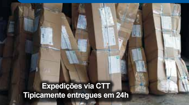
Expedições via CTT Tipicamente entregues em 24h