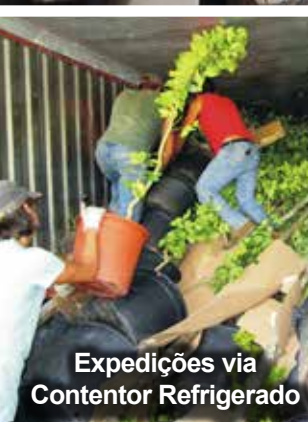
Expedições via Contentor Refrigerado